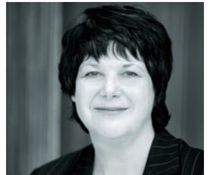
BENTE NYLAND, OLJEDIREKTØR