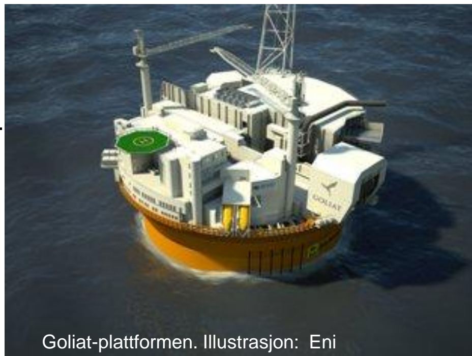
Goliath-plattformen. Illustrasjon: Eni

Tiltakskost beregnet til 1350 og 3100 kr per tonn CO 2