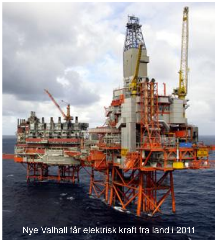
Nye Valhall får elektrisk kraft fra land i 2011

Dette er store og kompliserte industriprosjekter. Mulig å kutte maks 3 millioner tonn innen 2020